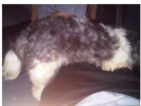
ส่วนเจ้าคิกเกอร์สงสัยจะเหนื่อย

มันเริ่มมอง และเดินไม่หยุดเหมือนหมาไฮเปอร์ยังงัยงั้นเลยทีเดียว เดี่ยวดูจรด เดี่ยวคู้ตรงนั้นเขี่ยตรงนี้