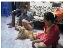
นั่งดูทีวีซะด้วยขาหน้าสองข้างจะวางแบบนี้เสมอ

พ่อ คนแถวบ้านแพรว ตื่นเต้นกันใหญ่เลยซูโมไฮเปอร์มากเดินไม่หยุดพอเหนื่อยก็จะมานั่งพักหน้าพัดลม