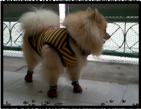
อ้อคือขี้ไก่ของสี อ้อ แต่พวกเค้าหลอกผมกันหมดเลย ทั้งผมอยู่บ้านคนเดียว