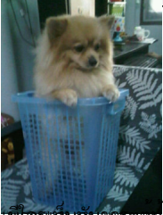
เลี้ยงด้วยขี้ไก่(หมักตากแห้ง) ตระกร้าไปเลยละฮะ เดินเข้าใกล้ได้แต่อย่ามาครอบผมนะ