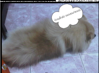
ผมเบตหลุงลมหัวผมมันจะขยี้ขยี้แล้วขยี้ขยี้ขยี้หะ คุ้รับก็ขยี้ขยี้ทุกคน >< ไว้พบกัันใหม่ โห้ะๆ