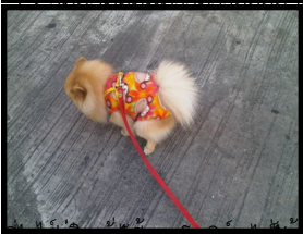
ขี้ไก่หมักตากแห้งคือของที่ดีกว่าขี้ไก่สดๆที่เพิ่งเอามาสดๆ/ต้องนั่งทำพุกันยกใหญ่เลย