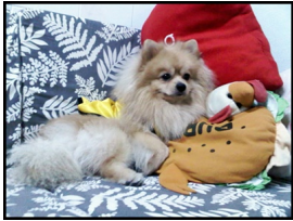
สวัสดีคับ สวัสดีคับ :)

กระผมหมีไม่รายงานตัวอย่างเป็นทางการ หลังจากหายไปประมาณเดือน-2เดือนได้ละมั้ง เอ๊กๆๆๆ