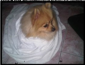
เลยกลายเป็นโดหมาไปเลย 55555+