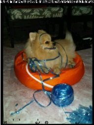
ส่วยเรื่องอึ้งใจจะอยู่กันแน่ ><